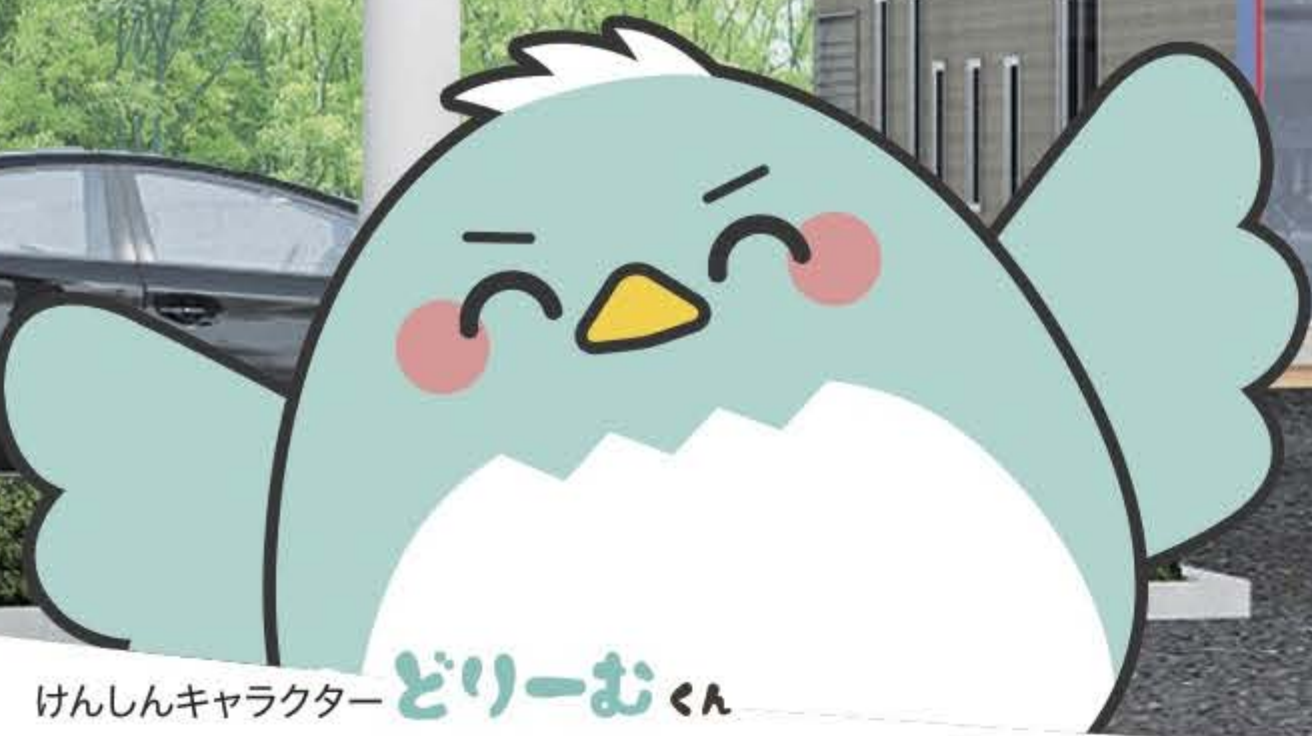
けんしんキャラクター どりーおくん