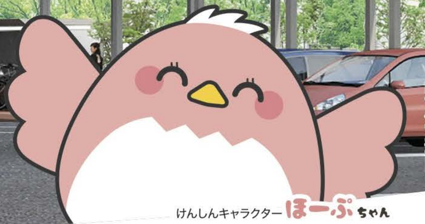
けんしんキャラクター ほーぷちゃん